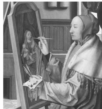
Quentin Massys, Der heilige Lukas malt die Jungfrau mit dem Kind, um 1520

Kollekte: Welttag der Kommunikationsmittel