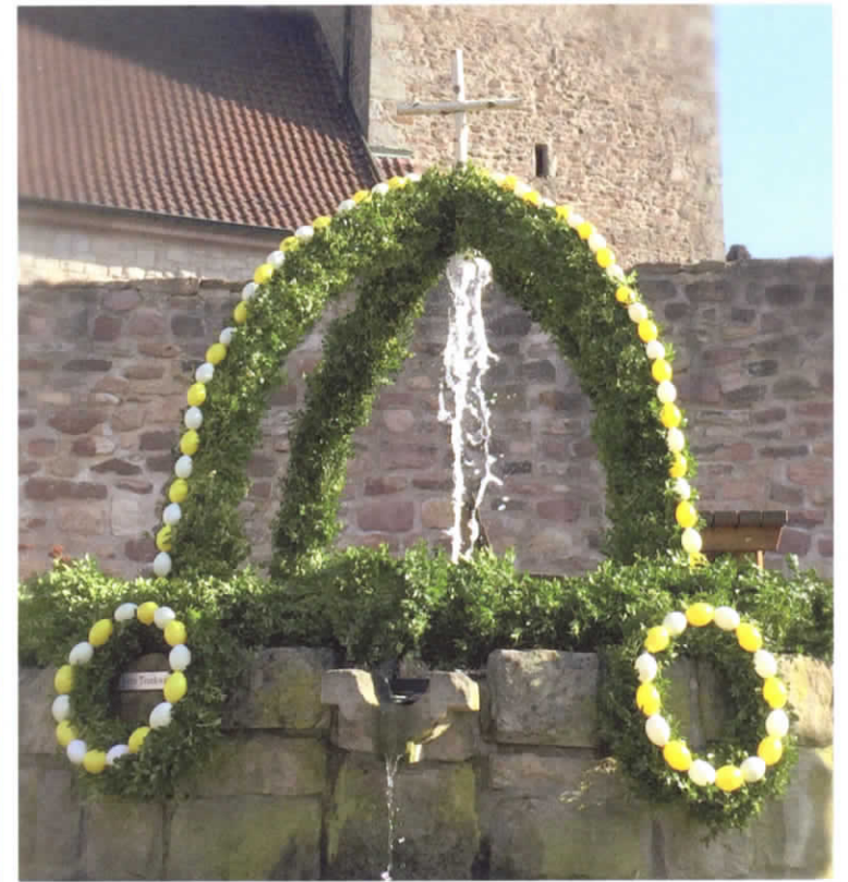
Osterbrunnen in Ried